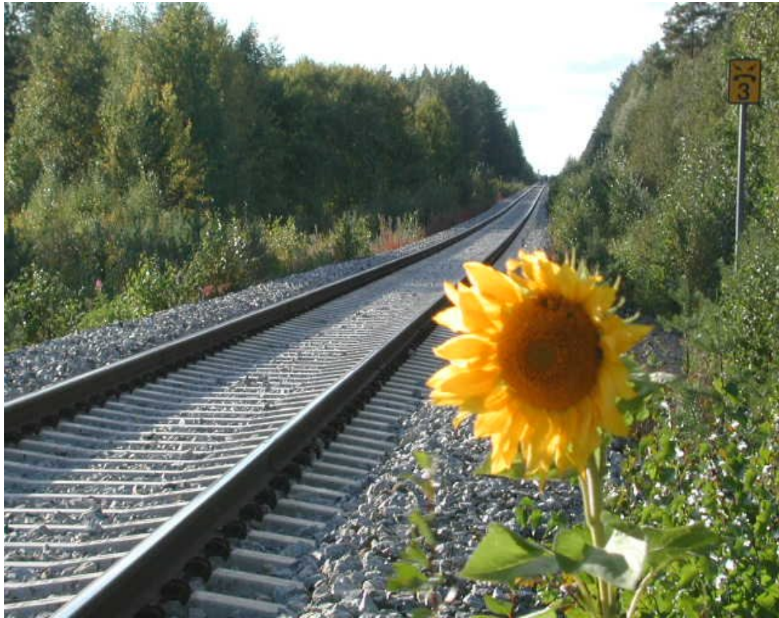
Joutikimion tasoristeys