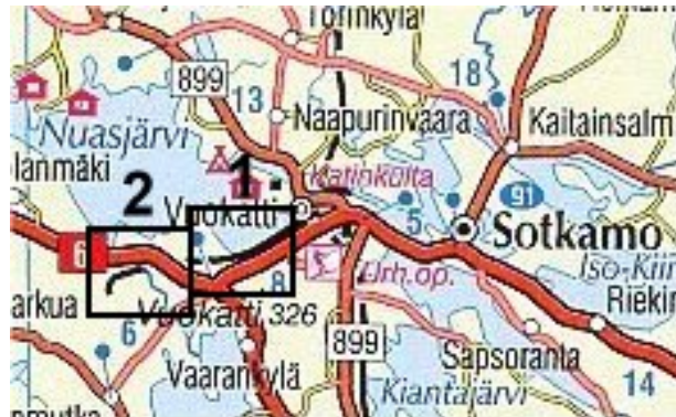
Kuva 3. Vuokatti–Lahnaslampi -rataosa (numerot viittaavat liitteen A karttoihin).

Vuokatti–Lahnaslampi -rataosa (kuva 3) on 11 km pitkä ja yksiraiteinen. Rataosalla on vain tavaraliikennettä. Rataosan nopeusrajoitus on 50 km/h ja sillä on 10 tasoristeystä.