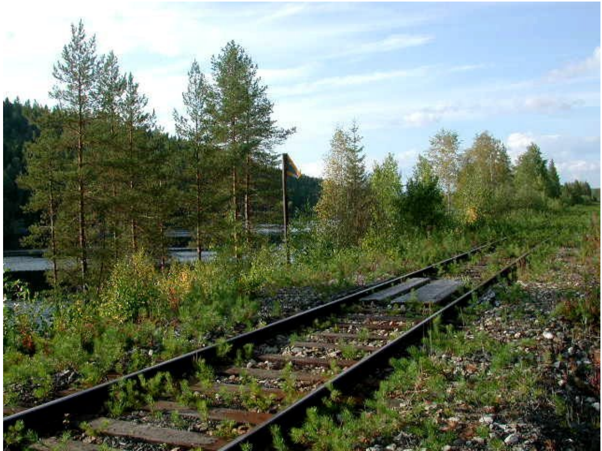
Kuva: Antti Seise, Kohisevan tasoristeys