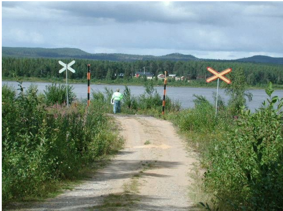
Savitörmän tasoristeys