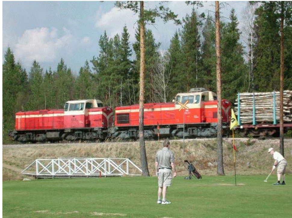
Kotilantien tasoristeys