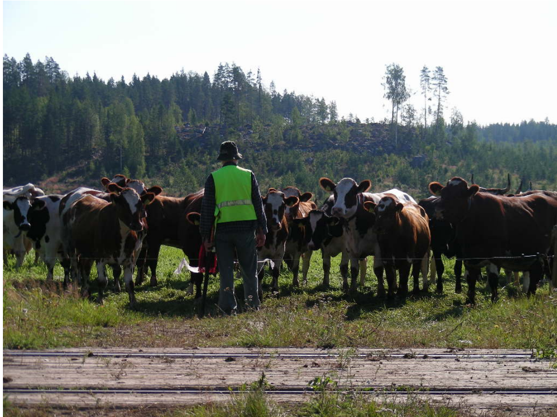
Ylälehdon tasoristeys