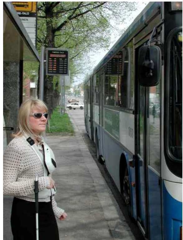
Kuva 3. Mukana-älyliivi käytössä.